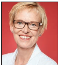
Karine LALIEUX Ministre fédérale des Pensions et de l'Intégration sociale, chargée des Personnes handicapées, de la Lutte contre la pauvreté et de Beliris