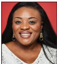
Lydia MUTYEBELE NGOI Échevine du Logement, du Patrimoine public et de l'Égalité des chances