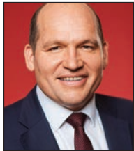
Philippe CLOSE Bourgmestre de la Ville de Bruxelles