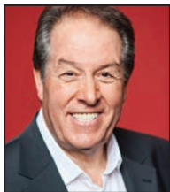
Ahmed EL KTIBI Échevin de l'Etat civil, de la Population et de la Solidarité internationale