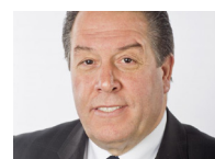
AHMED EL KTIBI PRÉSIDENT DU CPAS