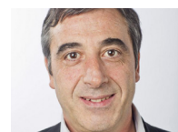
KHALID ZIAN ECHEVIN DE L'ENVIRONNEMENT, DU DÉVELOPPEMENT DURABLE ET DES ESPACES VERTS