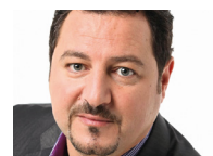
MOHAMED OURIAGHLI ECHEVIN DU LOGEMENT, DE L'INFORMATIQUE, DE L'ÉGALITÉ DES CHANCES ET DE LA SOLIDARITÉ INTERNATIONALE