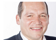
PHILIPPE CLOSE BOURGMESTRE